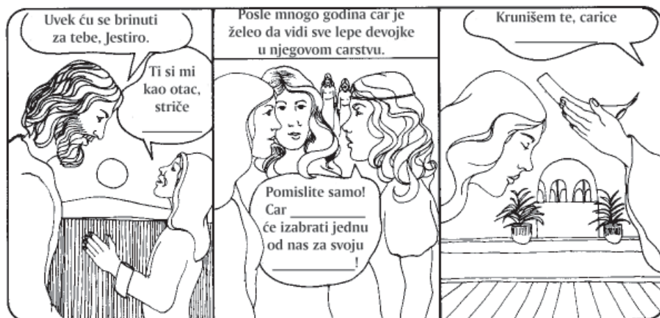
Manasija, Mardoheju, Miheju

Izaberi tačnu reč ispod slike i popuni praznine u stripu.